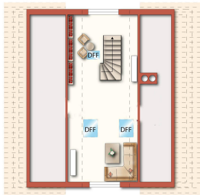
Dachspitz (unverbindl. Illustration)