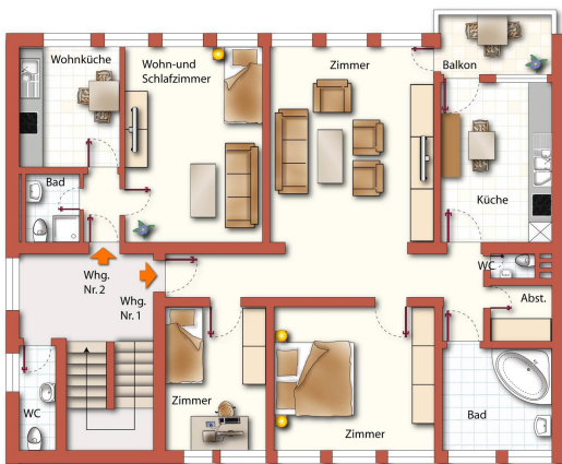
2. OG (unverbindliche Illustration)