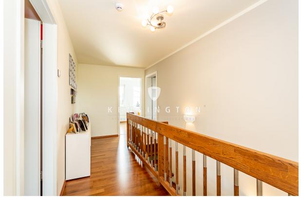
Galerie im OG