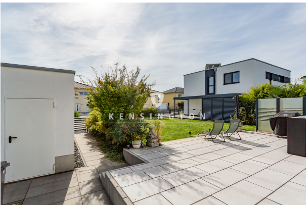
Ausblick in den Garten