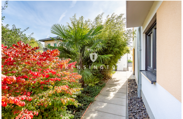
Weg zum Hauseingang