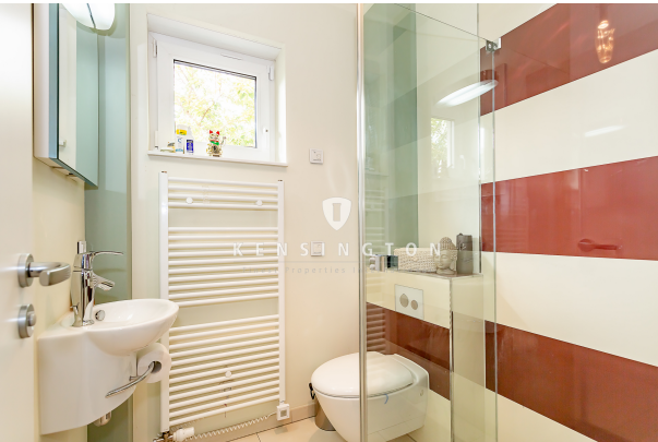
Duschbad im EG