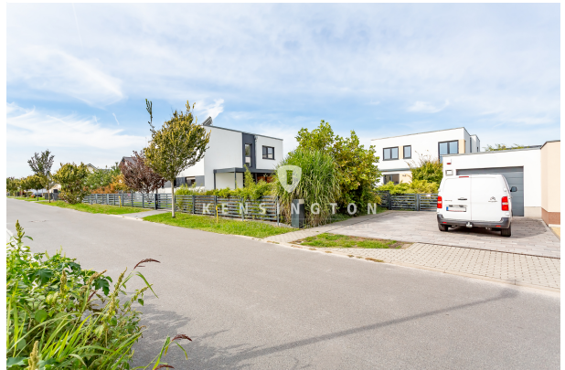
Einfahrt und Blick auf das Haus