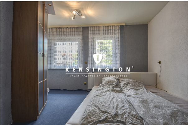
KSW313-Haus in Essingen-Schlafzimmer EG