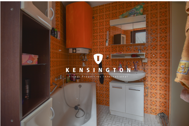
KSW313-Haus in Essingen-Bad EG