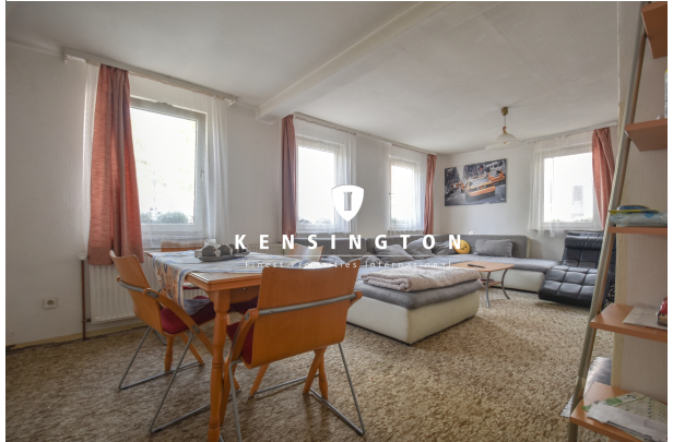
KSW313-Haus in Essingen-Wohnzimmer EG