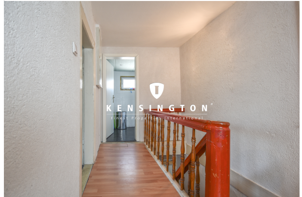
KSW313-Haus in Essingen-Treppenabgang innen