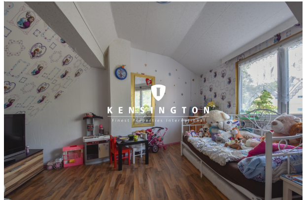
KSW313-Haus in Essingen-Kinderzimmer OG