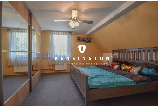
KSW313-Haus in Essingen-Schlafzimmer OG