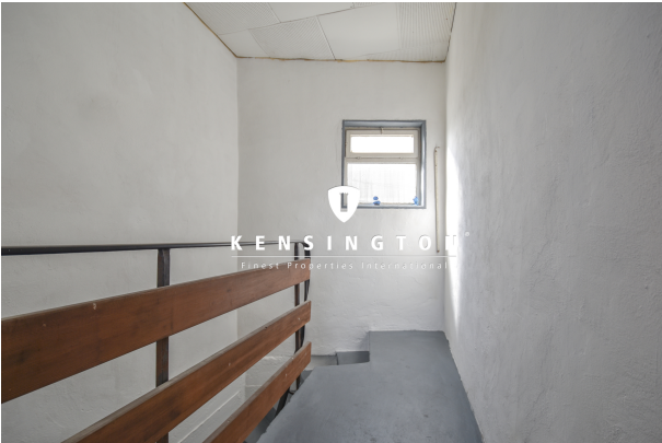
KSW313-Haus in Essingen-Treppenabgang