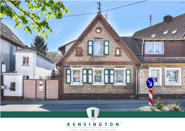
KSW313-Haus in Essingen