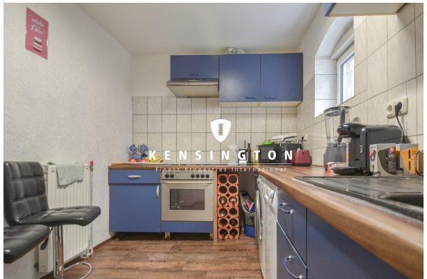
KSW313-Haus in Essingen-Küche EG