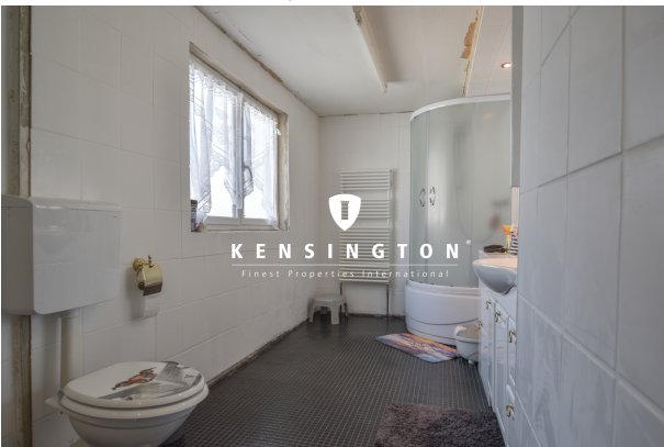
KSW313-Haus in Essingen-Bad OG