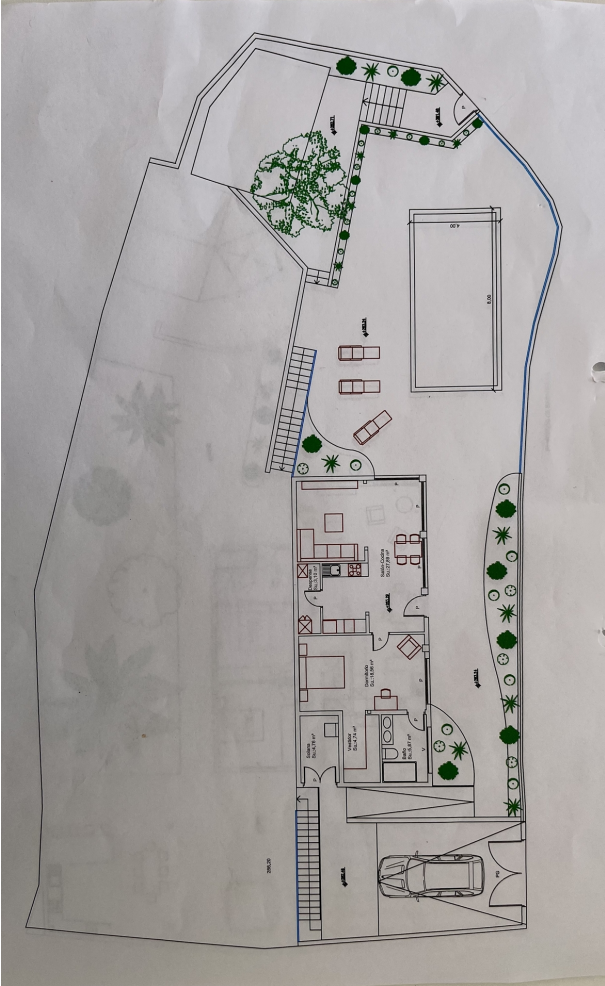
Grundriss Schäfer 2