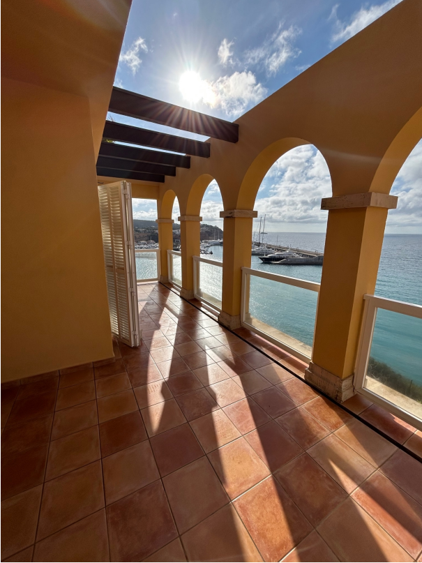
Balcon con vistas al mar