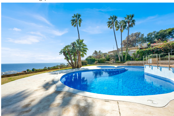
2. Swimming pool