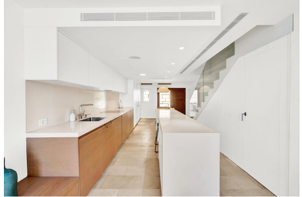
9. Townhouse for sale