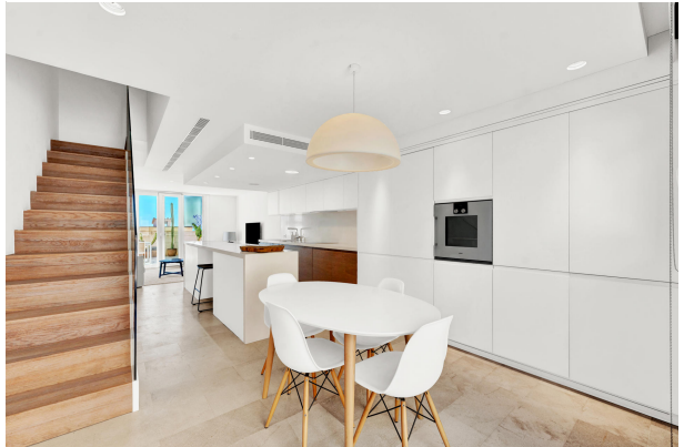
Townhouse for sale in Illetas