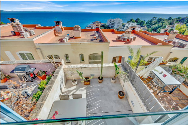
17. Terrace views