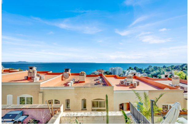
16. Views from the bedroom