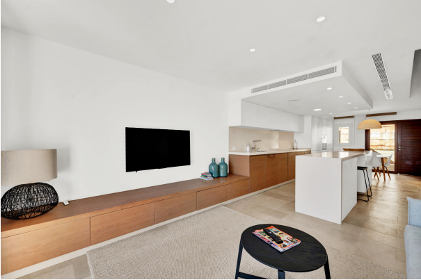
8. Living room in Illetas