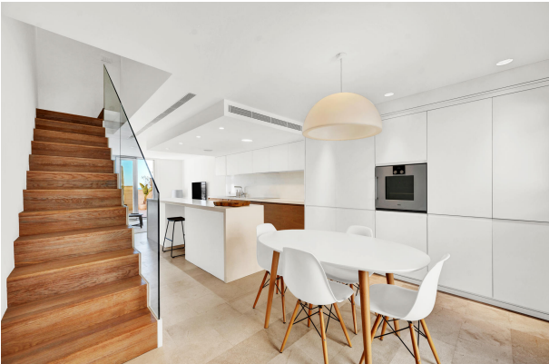
5. Dining area in Illetas