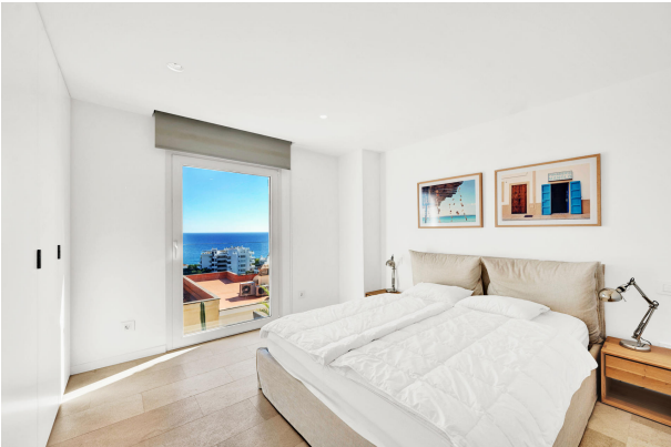
10. Master bedroom