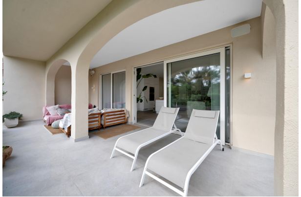
Garden apartment for sale in Portals