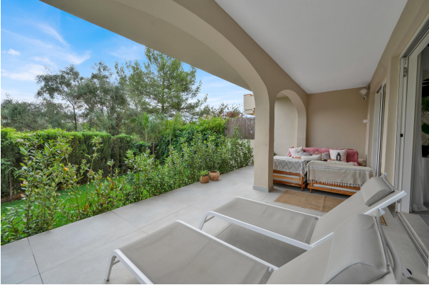
Terrace in Portals garden apartment