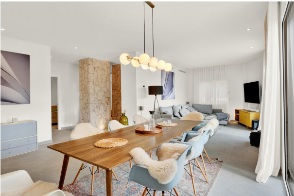
Dining area in Portals