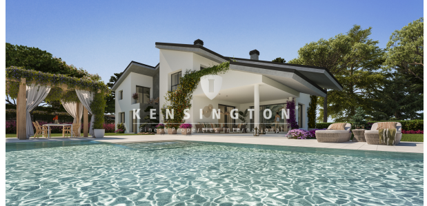
Captura de pantalla 2024-01-09 111052