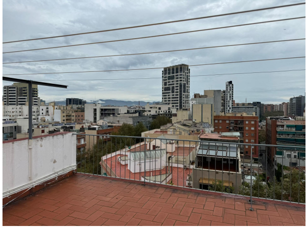
WhatsApp Image 2024-09-23 at 12.39.14 (1)