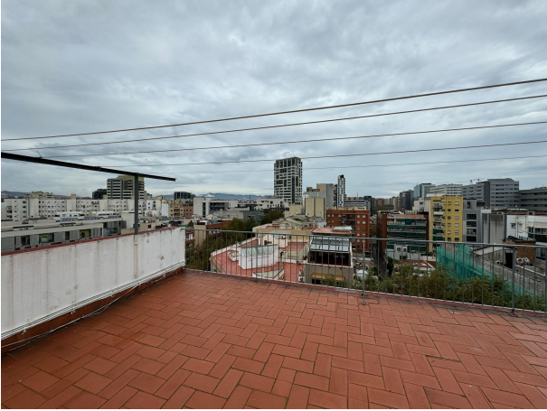
WhatsApp Image 2024-09-23 at 12.39.14 (2)