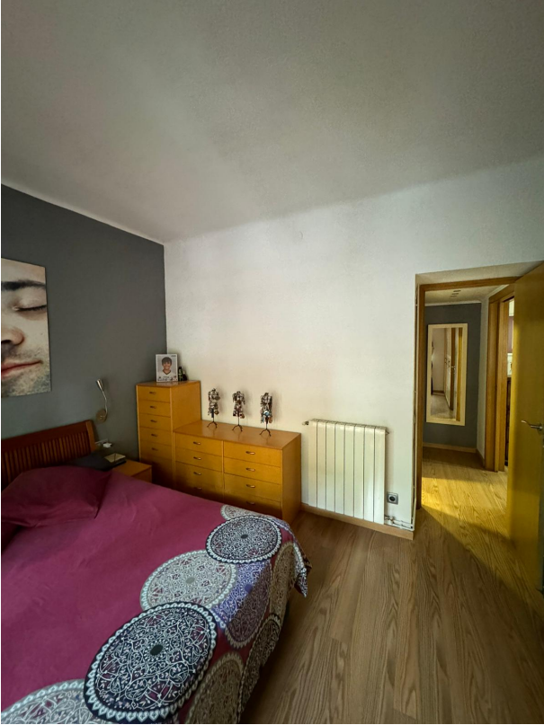
WhatsApp Image 2024-09-23 at 12.39.06 (1)