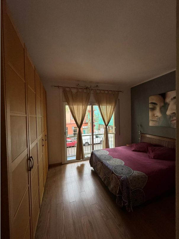
WhatsApp Image 2024-09-23 at 12.39.16 (2)