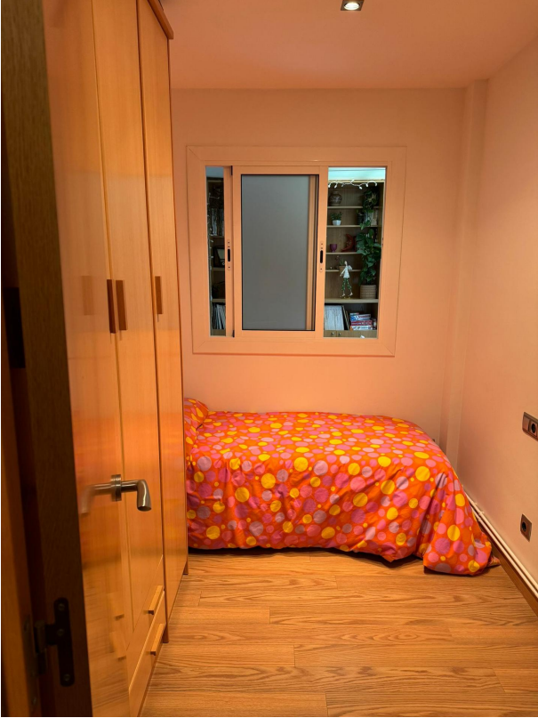
WhatsApp Image 2024-09-23 at 12.39.13