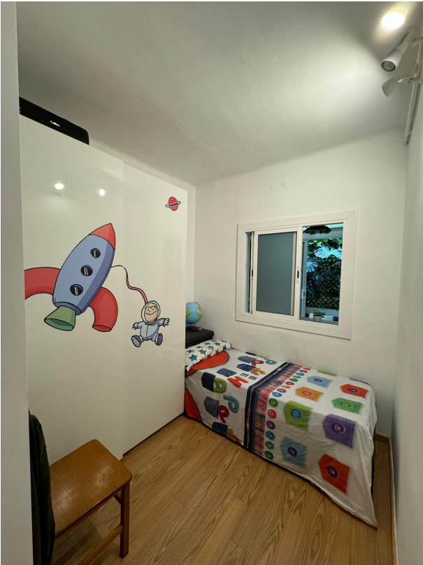
WhatsApp Image 2024-09-23 at 12.39.09