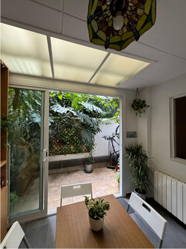
WhatsApp Image 2024-09-23 at 12.39.12