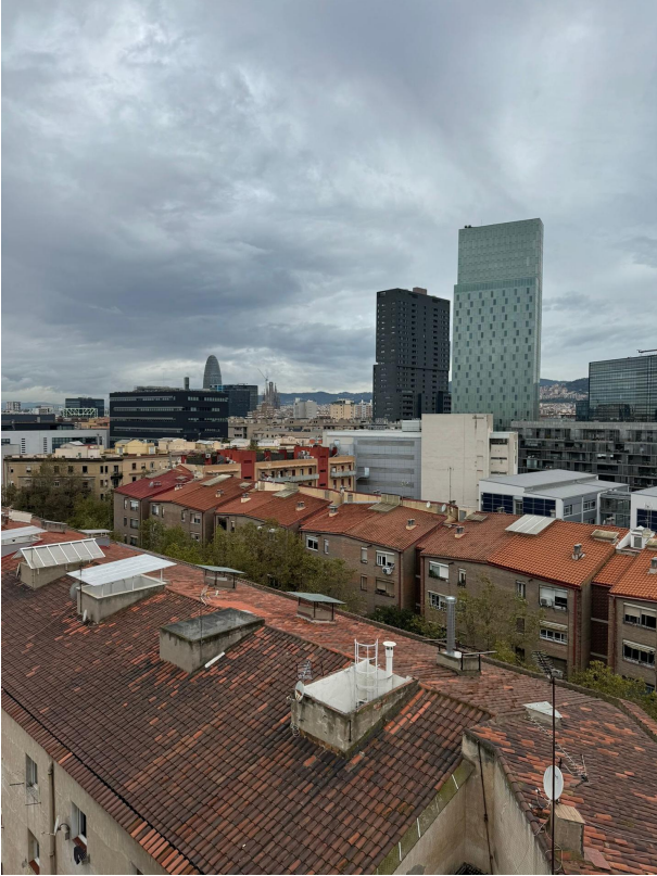
WhatsApp Image 2024-09-23 at 12.39.16