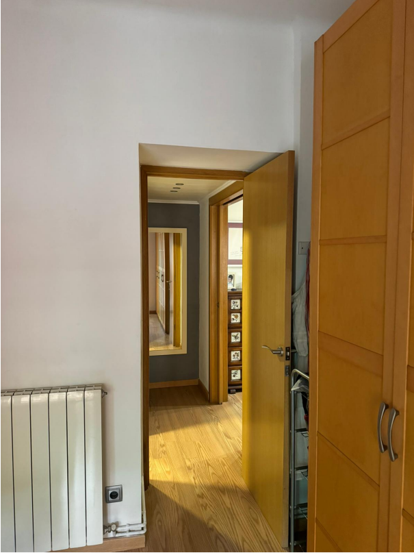
WhatsApp Image 2024-09-23 at 12.39.07 (1)