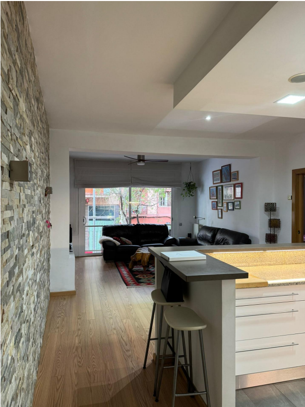
WhatsApp Image 2024-09-23 at 12.39.14