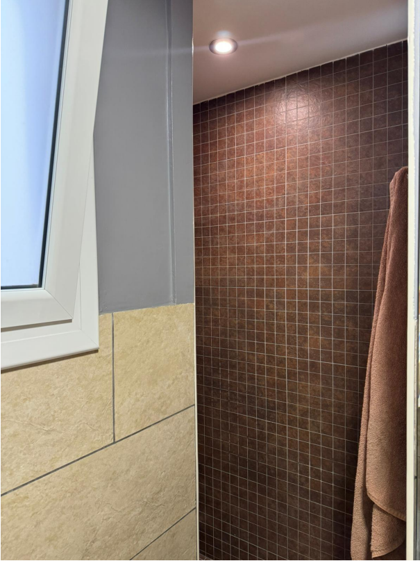
WhatsApp Image 2024-09-23 at 12.39.08