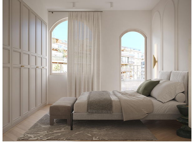
Copia de 1