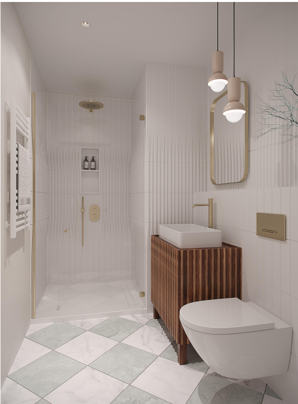
11 copy (1)