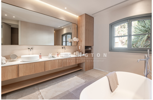
Chalet en Port Andratx, Mallorca baño