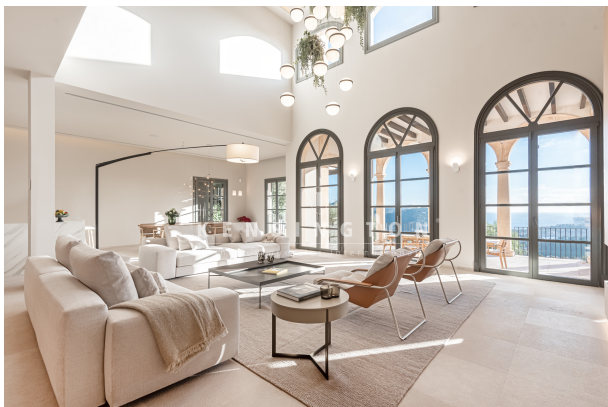
Chalet en Port Andratx, Mallorca salón