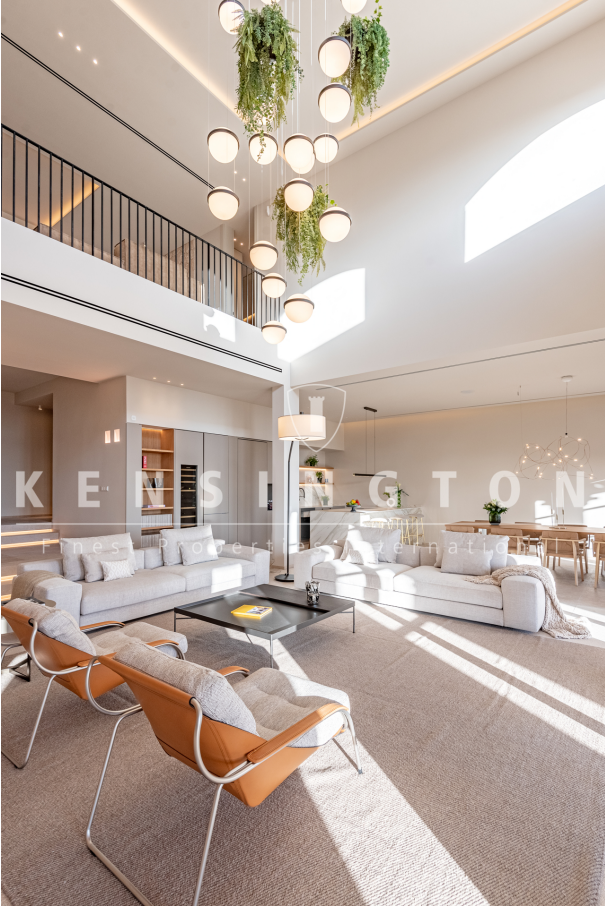
Chalet en Port Andratx, Mallorca comedor