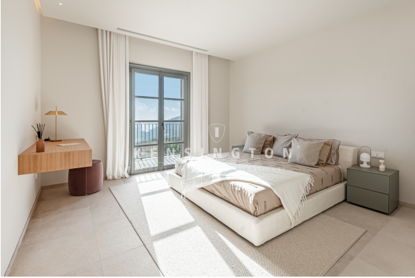
Chalet en Port Andratx, Mallorca dormitorio