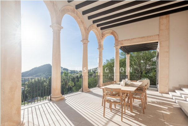
Chalet en Port Andratx, Mallorca terraza y vistas