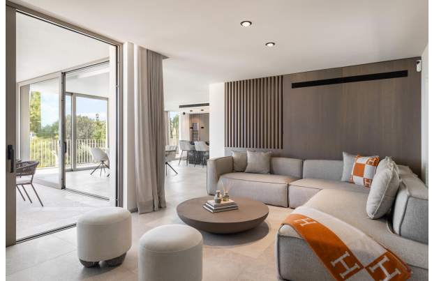
Kopie von 16