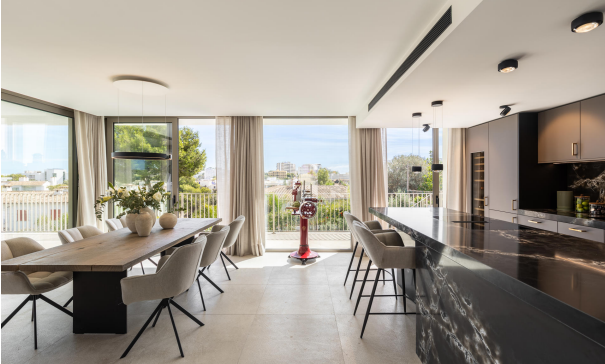
Kopie von 7