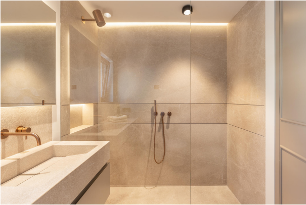
Kopie von 22