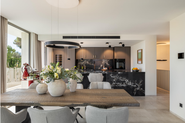
Kopie von 12