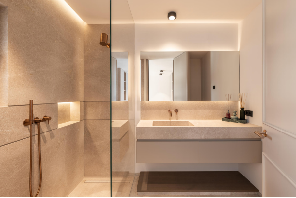
Kopie von 25