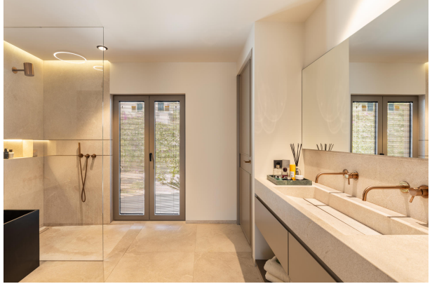
Kopie von 19