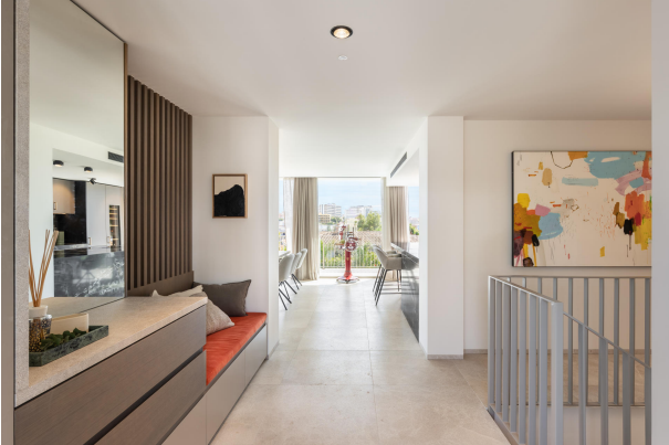
Kopie von 6