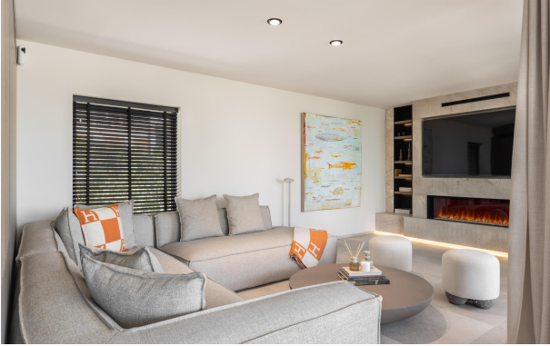
Kopie von 15