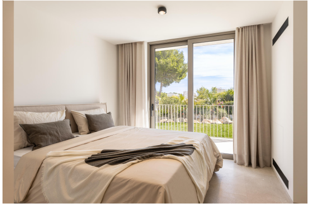
Kopie von 21