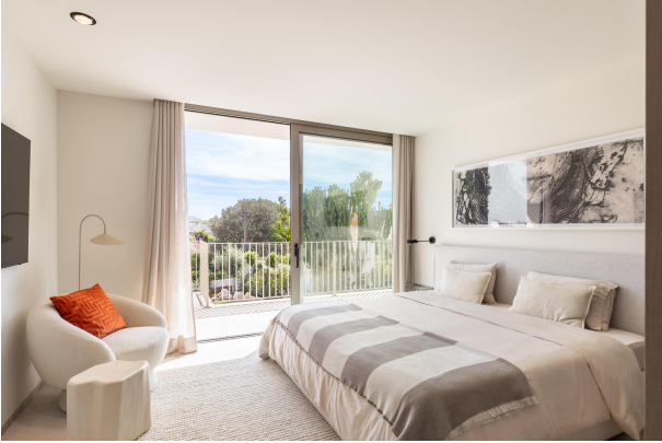
Kopie von 17