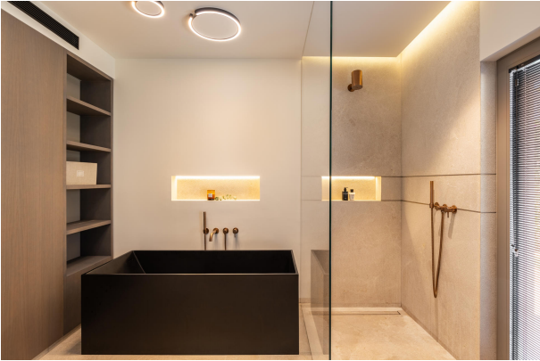
Kopie von 20