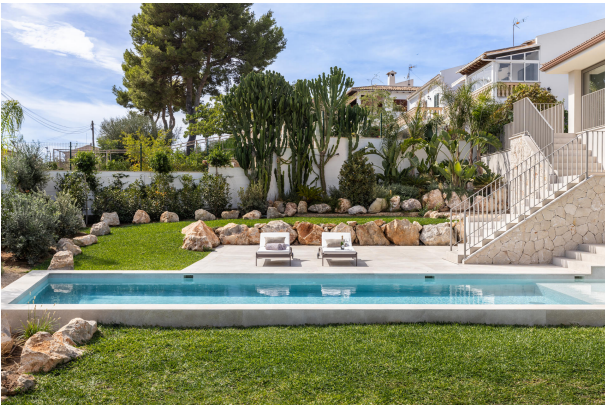
Kopie von 2