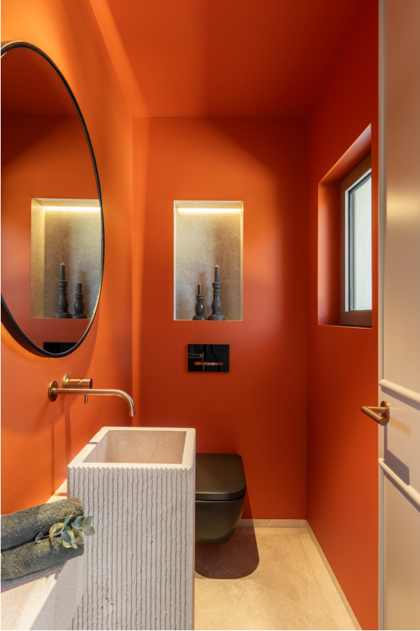
Kopie von 14