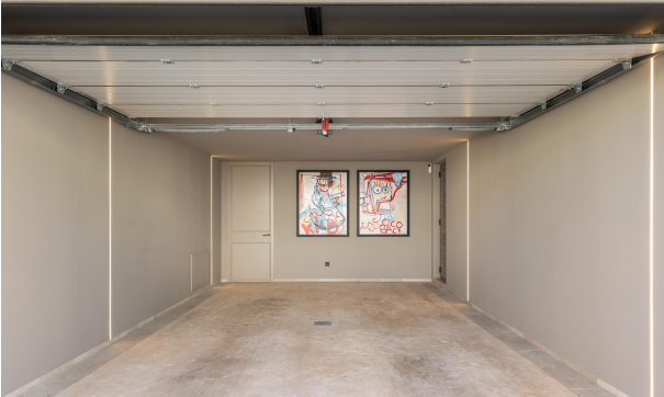
Kopie von 29